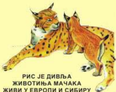
РИС ЈЕ ДИВЉА ЖИВОТИЊА МАЧАКА ЖИВИ У ЕВРОПИ И СИБИРУ

РОДА ЈЕ БАРСКА ПТИЦА ЈЕДЕ ЖАБЕ И МАЛЕ РИБЕ