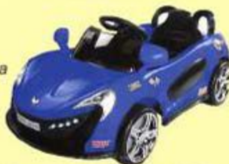
АУТОМОБИЛОМ СЕ ВОЗИМО ПО ЗЕМЉИ ПУТЕВИМА