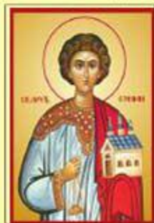
СВ. АРХИЋАКОН СТЕФАН

Свети Стефан је био архијакон првобитне Јерусалимске цркве и сродник апостола Павла. Стефан је био први од седам ђакона, које су свети апостоли рукоположили и поставили на службу око помагања сиромашних у Јерусалиму. Зато је назван архијакonom. Био је Јеврејин који је живео у грчким областима Римског царства. Страдање светог Стефана збило се годину дана после, односно исте године када се Господ вазнео на небо. Свети Стефан је први хришћанин који је страдао за Господа и зато се назива Првомучеником