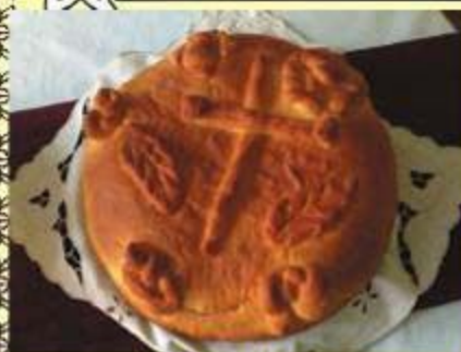
ЧЕСНИЦА БОЖИЋНА ПОГАЧА