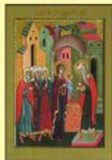
ОБРЕЗАЊЕ ГСПОДА ИСУСА ХРИСТА

У осми дан по рођењу би Младенац божански донесен у храм и обрезан сходно закону постојећем у Израилу још од времена Аврамова. Том приликом дадоше му име Исус како је и благовестио архангел Гаврил Пресветој Деви. Старозаветно обрезање предображава новозаветно крштење. Обрезање Господа показује, да је Он примио на себе истинско тело људско а не привидно, како су доцније учили о Њему јеретици. Још је Господ обрезан и за то што је хтео да испуни сав закон, који је Он сам дао кроз пророке и праоце. Испунивши тај пропис законски Он га је заменио крштењем у цркви Својој.