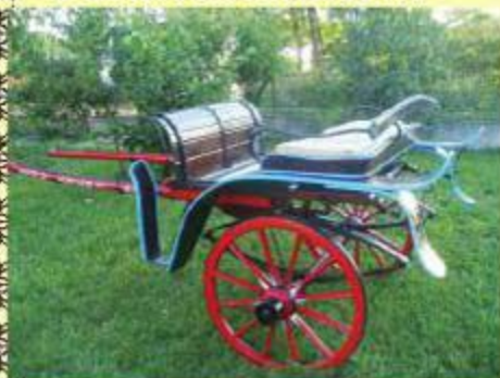
ЧЕЗЕ-КОЛА СА ДВА ТОЧКА