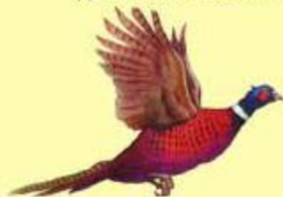
ФАЗАН ЛЕПА ДИВЉА ПТИЦА ИЗ ВРСТЕ ДИВЉЕ КОКЕ

ФРУЛА ЈЕ НАЈСТАРИЈИ ИНСТРУМЕНТ НА СВЕТУ НАРОЧИТО СУ ГА СВИРАЛИ ЧОБАНИ ДОК СУ ЧУВАЛИ ОВЦЕ