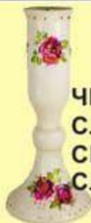
ЧИРАК-СВЕЋЊАК СЛУЖИ ЗА ДРЖАЊЕ СВЕЋЕ НАЈЧЕШЋЕ СЛАВСКЕ