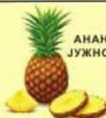
АНАНАС ЈЕ ЈУЖНО ВОЋЕ