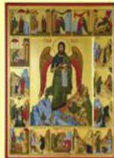
САБОР СВЕТОГ ЈОВАНА КРСТИТЕЉА

Православна Црква 20. по новом, а 7. јануара по старом календару, молитвено обележава Сабор светог Јована Крститеља. Живот Јованов, по много чему, подсећа на земаљски живот самог Господа Христа, чији је он Пророк, Претеча и Крститељ. Његово рођење, иако природно, од биолошких родитеља, Захарије првосвештеника и старице Јелисавете, дугогодишње нероткиње, десило се по сили Божјој. И његово рођење најавио је Анђео Божји, као и Исусово. И светом Јовану, као и Господу Христу, име даје сам Бог преко свога Анђела. И једно и друго рођење доносе велику радост људима. Касније, свети Јован живи и духовно се усавшава у пустињи, као што је и Господ Исус Христос, неко време, пре него што ће почети Своју јавну месијанску проповед и делатност, провео у пустињи.