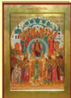
САБОР ПРЕСВЕТЕ БОГОРОДИЦЕ

Други дан Божића Црква хришћанска одаје славу и хвалу Пресветој Богородици, која роди Господа и Бога и Спаса нашега Исуса Христа. Сабором се њеним назива ово празновање зато, што се тога дана сабирају сви верни, да прославе њу, Матер Богородицу, и што се торжествено, саборно, служи у част Њену.