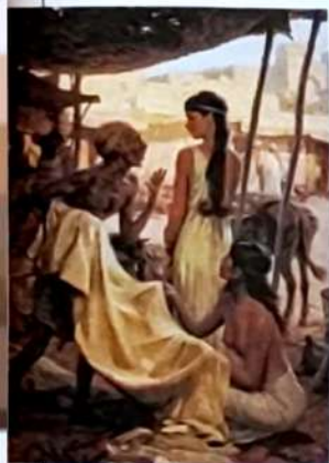
Пијаца тканина у граду Мари.

У Месопотамији (што на грчком значи „међуречје”), развиле су се између Тигра и Еуфрата неке од најпознатијих старих цивилизација. Наиме, ова широка равница је са својом сушном и топлом климом, али и великим могућностима наводњавања, развила богату земљорадњу која јој је донела назив „плодни полумесец” и која је пружала бројне погодности народима који су се ту настанили. То су били прво Сумери, о којима су сведочанства пронађена тек у релативно скорије доба (око 1940. године). Археолошка ископавања која је енглески археолог Лионард Вули покренуо у близини града Ур открила су зиџураи , вишеспратну правоугаону грађевину намењену посматрању неба, на чијем се врху уздизао храм. Сумери су били подељени у независне градове-државе, од којих је сваки имао на че-