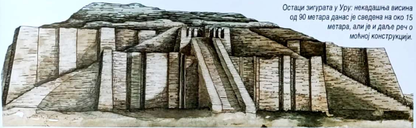
Остаци зигурата у Уру: некадашња висина од 90 метара данас је сведена на око 15 метара, али је и даље реч о моћној конструкцији.

У Месопотамији (што на грчком значи „међуречје”), развиле су се између Тигра и Еуфрата неке од најпознатијих старих цивилизација. Наиме, ова широка равница је са својом сушном и топлом климом, али и великим могућностима наводњавања, развила богату земљорадњу која јој је донела назив „плодни полумесец” и која је пружала бројне погодности народима који су се ту настанили. То су били прво Сумери, о којима су сведочанства пронађена тек у релативно скорије доба (око 1940. године). Археолошка ископавања која је енглески археолог Лионард Вули покренуо у близини града Ур открила су зиџураи , вишеспратну правоугаону грађевину намењену посматрању неба, на чијем се врху уздизао храм. Сумери су били подељени у независне градове-државе, од којих је сваки имао на че-